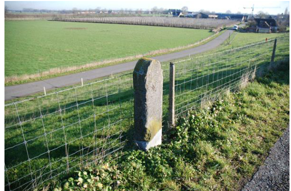
Graaf Reinald Alliantie

Object Grenspaal Heerlijkheid Hellouw; grenspaal Haaften / Hellouw