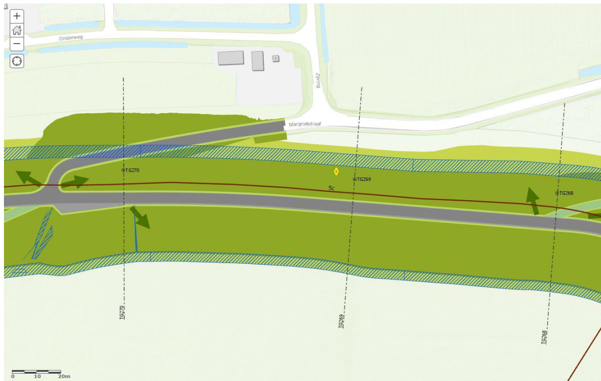
Profiel ter hoogte van dijkpaal TG269

Er vindt een buitenwaartse versterking plaats. De kruin van de dijk schuift naar buiten toe. De gralliantie dient de grenspaal op te nemen en na de werkzaamheden onbeschadigd terug te plaatsen op de kruin/binnentalud van de dijk, op de op de historische grens (lijn) tussen Hellow en Haaften.